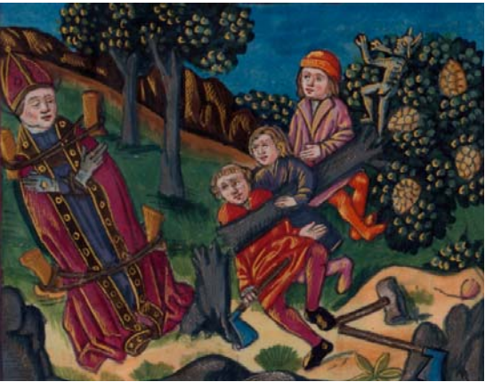
La Vie et miracles de monseigneur saint Martin, translatée de latin en françois. Tours, imprimé par Mathieu Latheron pour Jean de Marnef dit Jean de Liège, 1496. BNF, Réserve des livres rares, Vélins 1159

la cité terrestre que pour préparer l'avènement de la cité céleste. L'humilité et la chasteté caractérisent le saint quand le héros cherche la gloire, insiste sur sa dimension érotique et crée un personnage de femme séduite par ses exploits. Un acte suffit pour être qualifié de héros quand toute une vie est nécessaire pour devenir un saint.